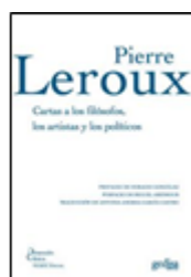
Cartas a los filósofos, a los artistas y a los políticos Pierre Leroux 978-84-9784-265-5