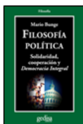
Filosofía Política Mario Bunge 978-84-9784-331-7