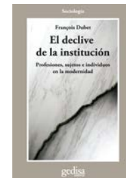
El declive de la institución François Dubet 978-84-9784-770-4