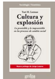
Cultura y explosión Yuri Lotman 978-84-9784-786-5