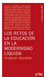
Los retos de la educación en la modernidad líquida Zygmunt Bauman 978-84-9784-229-7