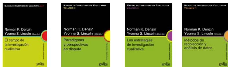
El campo de la Investigación cualitativa - Vol. I Paradigmas y perspectivas en disputa - Vol. II Las estrategias de investigación cualitativa - Volumen III Métodos de recolección y análisis de datos - Volumen IV Norman Denzin e Yvonna S. Lincoln